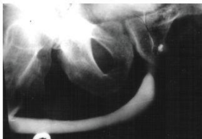
Рис. 4. Одиночная каверна предстательной железы

12. Терапия ex juvantibus . Если не удалось получить убедительных данных за туберкулез, но сомнения остаются, показано проведение терапии ex juvantibus – вначале первого, а затем второго типа. Методики подробно описаны в соответствующих руководствах [3, 10, 14].