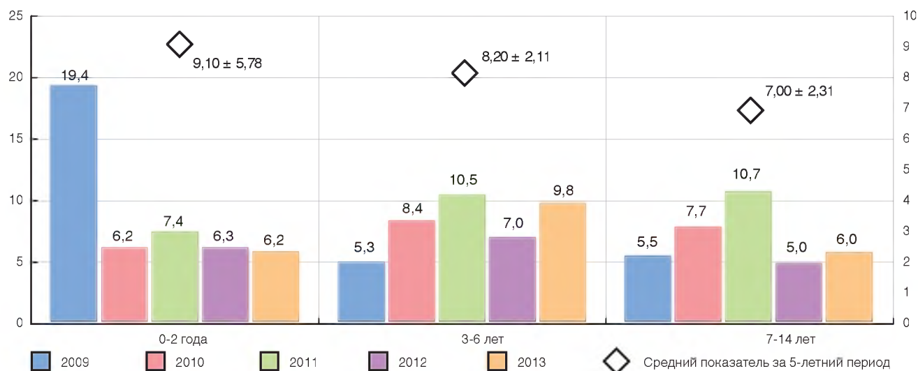
Рис. 2. Заболеваемость туберкулезом детей в разных возрастных группах в Саратовской области за 2009-2013 гг. (на 100 тыс.)

Среди детей от 0 до 14 лет в 2013 г. по сравнению с 2009 г. в структуре туберкулеза увеличилась доля туберкулезной интоксикации ( p = 0,0422 ), что обусловлено широким внедрением в практику компьютерной томографии (КТ) и пробы с диаскинтестом. У детей отмечались: интоксикационный синдром,