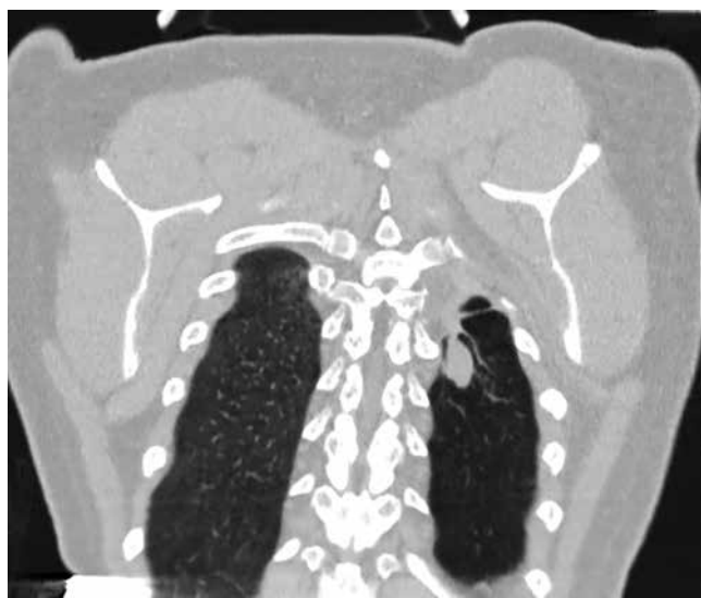
Рис. 5. РКТ, декабрь 2017 г. В левом оперированном легком отмечается появление крупного фокуса: плотного, с четкими контурами, расположенного субплеврально на фоне фиброзных тяжей, размером 25 \times 15 мм. В проекции ранее определявшейся полости сохраняются массивные явления цирроза

На 34-35-й неделе беременности для оценки клинической ситуации и определения дальнейшей тактики ведения проведено рентгеномографическое исследование органов дыхания. В левом оперированном легком отмечается появление крупного фокуса: плотного, с четкими контурами, расположенного субплеврально на фоне фиброзных тяжей, размером 25 \times 15 мм. В проекции ранее определявшейся полости сохраняются массивные явления цирроза. Клинический диагноз: туберкулема левого легкого. МБТ (-). ШЛУ МБТ (Н, R, S, E, K, T, Tar, Et, Cap, Rb, Cs). ДН II. Состояние после этапного хирургического лечения (рис. 5).