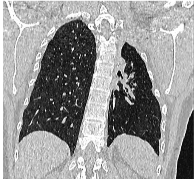
Рис. 4. РКТ, 2015 г. В левом оперированном легком инфильтративных и очаговых изменений не определяется, отмечается полное закрытие ранее определявшейся полости с формированием массивных явлений цирроза

Данные гинекологического анамнеза. Menarches в 14 лет, менструации – через каждые 28 дней, продолжались по 5-7 дней, умеренные и безболезненные. Половая жизнь с 18 лет, контрацепция – комбинированный оральная контрацептив (регулон), презервативы. В 2006 г. в возрасте 20 лет была пролечена в условиях гинекологического стационара по поводу двустороннего сальпингита. В возрасте 23 лет (2009 г.) возникла I беременность, которая