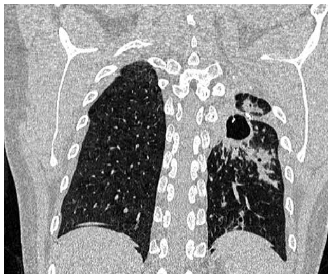
Рис. 1. РКТ, 2010 г. Состояние после двустороннего хирургического лечения легких. В прикорневой зоне слева, в послеоперационной зоне (прослеживаются цепочки металлических швов) определяется крупная полость с четкими внутренними контурами, нечеткими наружными. По периферии полости определяются инфильтративные изменения в виде фокусов, сливающихся очагов

Послеоперационный период осложнился несостоятельностью культи бронха и формированием пострезекционной эмпиемы плевры с бронхиальным свищом слева, в связи с чем с 07.11.2012 г. по