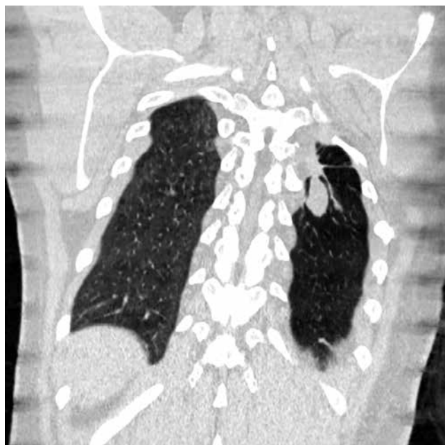
Рис. 6. РКТ, январь 2018 г. Отмечаются изменение формы ранее определявшегося фокуса, его неравномерное незначительное увеличение в размерах до 26 \times 16 мм. Фокус сохраняет гомогенную структуру, четкие контуры

На 3-и сут после родов проведено рентгеномографическое исследование органов дыхания: отмечаются изменение формы ранее определявшегося фокуса, неравномерное и незначительное увеличение его размера до 26 \times 16 мм. Фокус сохраняет гомогенную структуру, четкие контуры. Клинический диагноз: туберкулема левого оперированного легкого (рис. 6). С учетом отсутствия положительной рентгенологической динамики, наличия ШЛУ возбудителя решено продолжить химиотерапию по V режиму (фаза интенсивной терапии): пиперазид – 1,5 г; ПАСК – 8,0 г; циклосерин – 0,5 г; линезолид – 0,6 г; авелокс – 0,4 г; капреомидин – 1,0 г, в сочетании с методами патогенетической терапии, под контролем биохимических и гемостазиологических показателей крови. Пациентке рекомендовано отказаться от грудного вскармливания; БЦЖ-вак-