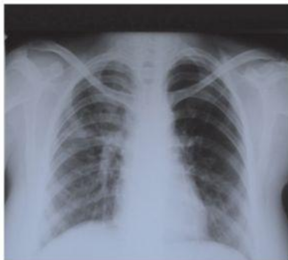
Рис. 2. На рентгенограмме легких определяются рассасывание очаговых и инфильтративных изменений, уменьшение полости распада с тенденцией формирования буллезно-дистрофических изменений в верхней доле правого легкого

Диагноз при выписке: ВИЧ-инфекция IVB, на АРВТ; туберкулез множественных локализаций –